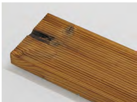
Všeobecne 8 cm od koncov dosiek nie je triedených.