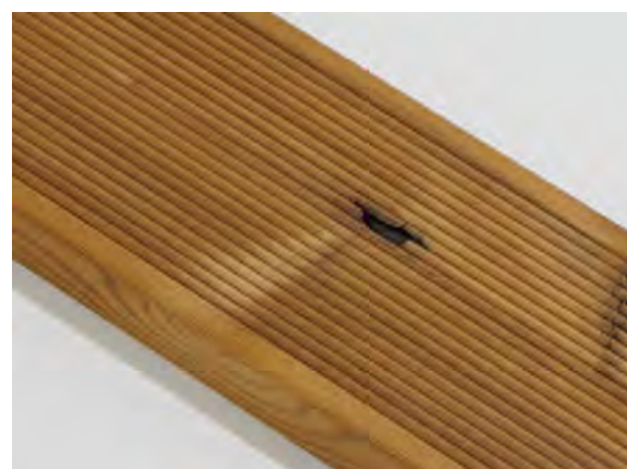
Malé viditeľné vady sú povolené.