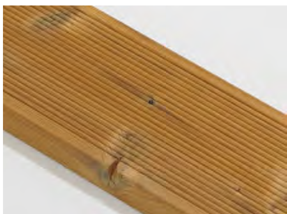
Malá prasklina suku na hrane je povolená.