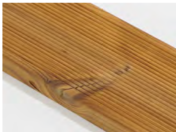
Jednoduchá prasklina suku je povolená.