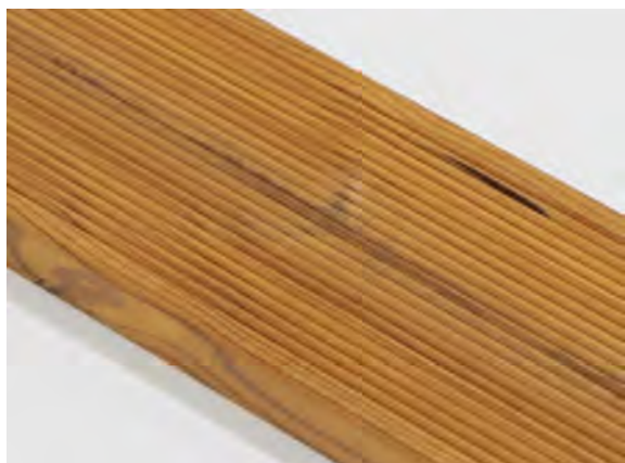
Smolníky sú povolené.