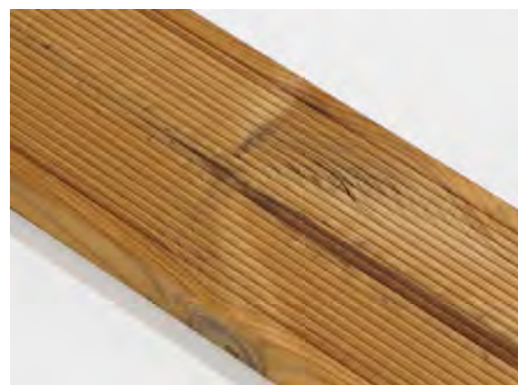
Malé pozdĺžne trhliny na povrchu sú povolené.

Rozmerové tolerancie väd sú špecifikované v samostatnom dokumente „Štandardy dodávok pre exteriérové profily ThermoWood® (materiál - borovica lesná, úprava Thermo-D). Kritéria kvality triedy materiálu „ThermoWood® A“.