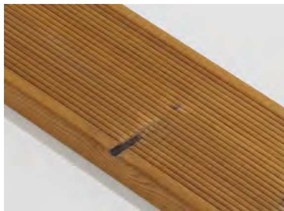
Malý chýbajúci suk je povolený.