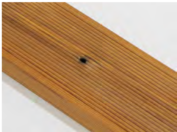
Malá diera po suku (nie skrz) na doske je povolená.