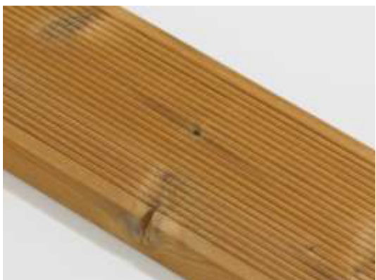
Malá prasklina suku na hrane je povolená.