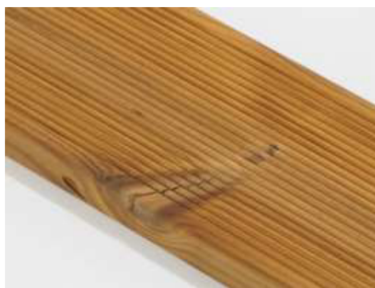
Jednoduchá prasklina suku je povolená.