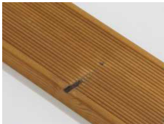
Malý chýbajúci suk je povolený.