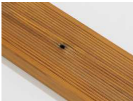
Malá diera po suku (nie skrz) na doske je povolená.