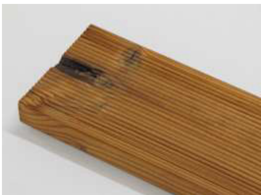
Všeobecne 8 cm od koncov dosiek nie je triedených.