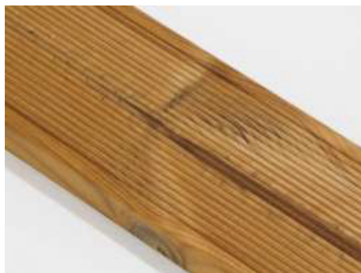
Malé pozdĺžne trhliny na povrchu sú povolené.

Rozmerové tolerancie vád sú špecifikované v samostatnom dokumente „Štandardy dodávok pre exteriérové profily ThermoWood® (materiál - borovica lesná, úprava Thermo-D). Kritéria kvality triedy materiálu „ThermoWood® A“.