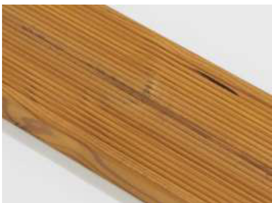
Smolníky sú povolené.